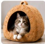
宠物用品(猫窝/狗窝)