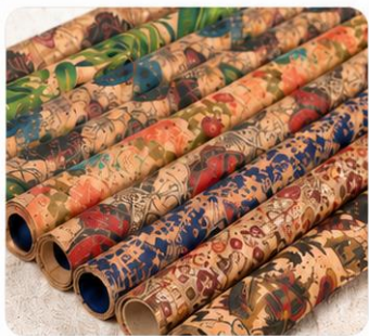
Printed Cork Fabric 印花软木系列