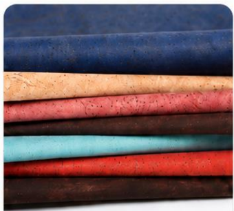
Colored Cork Fabric 彩色软木系列