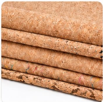
Natural Cork Fabric 天然软木系列